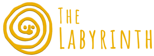
Figura 2. Il 45% delle spese che il turista compie durante il viaggio è a beneficio diretto comunitario , ovvero delle comunità indigene e locali del Guatemala. Il 27% del costo del tour è una spese non a beneficio comunitario , ricoprendo costi obbligatori, come: prima notte in Hotel, trasporti di linea dei bus guatemaltechi la notte ad Antigua, altro. Il 28% è rappresentato dai costi di mantenimento e guadagni di The Labyrinth .